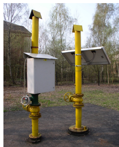
Umístění zařízení MARA-02

V katalogovém listu jsou pouze vybrané důležité parametry pro vaše rozhodování. Pro projektování si vždy vyžádejte uživatelskou příručku k tomuto výrobku a případnou technickou konzultaci o možnostech použití.