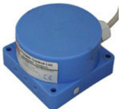
sonda dosah 6m