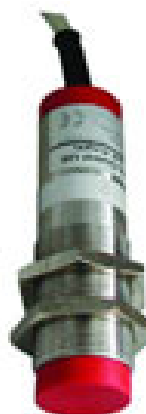
sonda dosah 1m